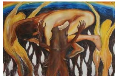
Gambar 3. Ilustrasi Tukang Pijat Keliling

skemata) terdapat gambar yang tidak diberi makna pada paparan teks selanjutnya yakni pada teks LHO. Ada juga teks Tukang Pijat Keliling ilustrasinya seperti ada sosok lelaki telanjang berada di atas pohon melukiskan kisah seseorang yang terbebani hidupnya. Gambar ini tidak selayaknya diberikan kepada siswa kelas X. Adapun ilustrasinya sebagai berikut.