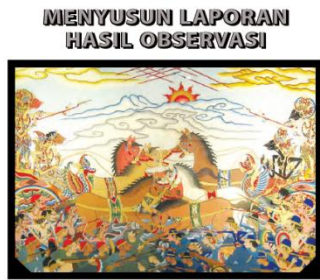
Gambar 6. Ilustrasi Teks LHO