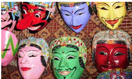
Gambar 1. Topeng Kayu

yang disajikan dalam teks LHO ada dua jenis yakni topeng batu dan kayu sedangkan gambar yang dimuat hanya topeng dari kayu. Sehingga peserta didik akan mengandaikan topeng dari batu. Untuk sekolah yang memiliki fasilitas lebih akan menyajikan gambar di LCD, sedangkan fasilitas yang kurang akan membiarkan peserta didik tidak paham dengan topeng batu. Adapun gambarnya sebagai berikut.