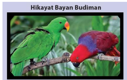
Gambar 4. Hikayat Bayan Budiman

peserta didik akan membaca secara runtut dari awal hingga akhir. Mereka menemukan sendiri maksud gambar yang disajikan dalam buku. Adapun ilustrasinya sebagai berikut.