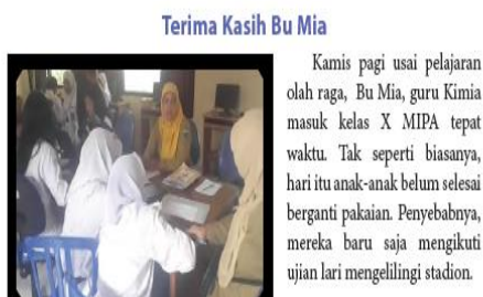
Gambar 2. Ilustrasi Terima Kasih Bu Mia

Selain itu, pada teks negosiasi dengan judul “Terima Kasih Bu Mia” yang menceritakan seorang guru di dalam kelas sangat baik pada muridnya. Ia memberikan kesempatan kepada muridnya untuk mengikuti ulangan di minggu depan, karena mengetahui muridnya habis olahraga. Gambar yang disajikan dua orang guru dan murid seperti berkonsultasi di ruang guru. Gambar ini tidak sesuai dengan konteks pada teks sebagai berikut.